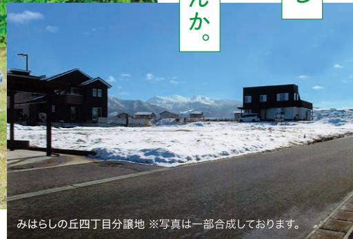
みはらしの丘四丁目分譲地 ※写真は一部合成しております。